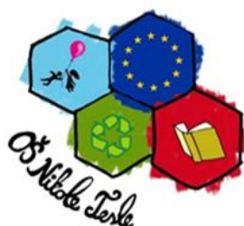
Logo Erasmus+ akreditacije (rad učenice)

Središte i polazište rada na sadržajima školskog kurikuluma jesu potrebe i interesi naših učenika, roditelja i lokalne zajednice.